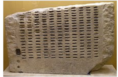
Un kleroterion en el Museo del Antiguo Agora (Atenas)

En Atenas, la "Democracia" (cuyo significado literal es "gobernado por el pueblo") estaba en oposición a quienes apoyaban un sistema oligárquico (gobernado por unos pocos). La democracia ateniense fue caracterizada por ser dirigida por "muchos" (la gente común) que fueron asignados por sorteo en los comités que dirigían el gobierno. Tucídides dice que Pericles en su Oración Funeral hace el siguiente punto: "Es administrado por muchos en lugar de unos pocos; es por eso que se llama democracia." 9